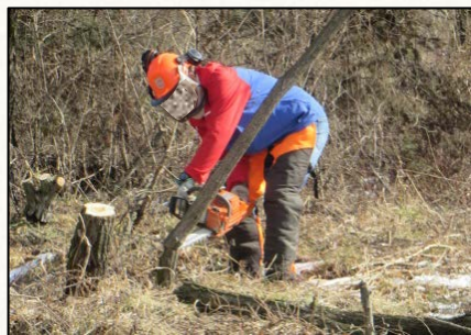
【昨年度伐採作業状況】

このため天竜川上流河川事務所では、無償で伐採・搬出を行う協力者を公募していましたが、このたび審査を踏まえ協力者を選定しましたので、お知らせします。