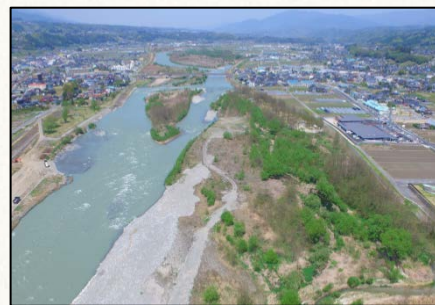
【伐採作業予定箇所(豊丘村神稲)】