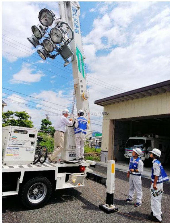
↑災害対策車操作体験