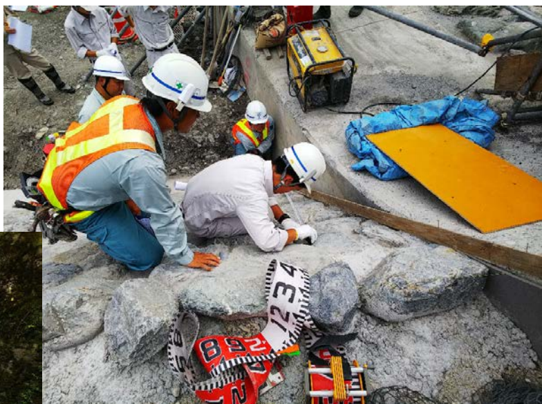
↑砂防工事現場監督実習