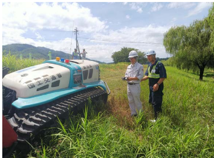
↑リモコン草刈り機操作体験