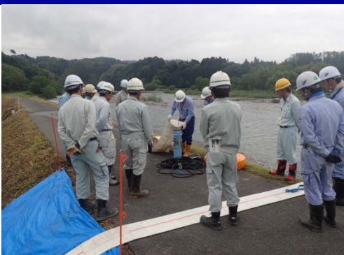
ポンプにホースを接続