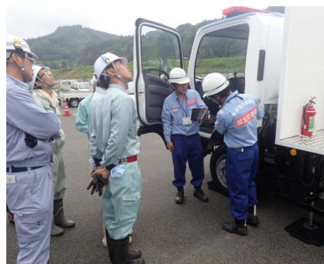
天上照明車(10m級)監視カメラの作動