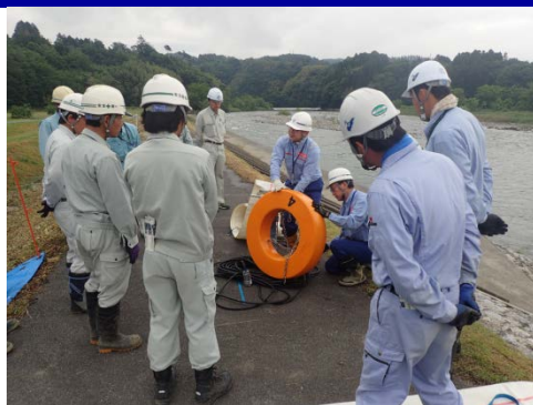
ポンプに浮き輪を取り付け

【日 時】 平成30年5月31日(木)9:30~16:00 AM・PM 2部 【参加団体】 長野県南部防災対策協議会、関係自治体 103名 【主 催】 天竜川上流河川事務所、飯田国道事務所 【場 所】 上伊那郡中川村片桐地先(天の中川河川公園) 【訓練車両】 排水ポンプ車(2台)、照明車(3台)