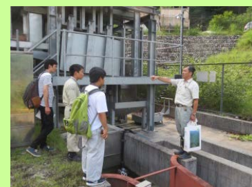
与田切流砂観測施設の 見学