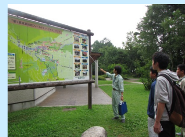
太田切床固工群と フィールドミュージアムの見学