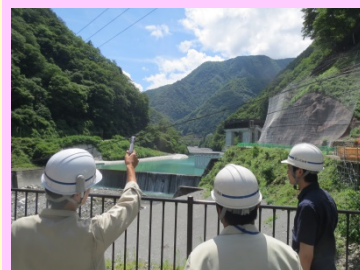
小渋ダム堤体内及び 土砂バイパストンネルの見学