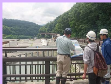
美和ダム堤体内及び 湖内堆砂対策施設工事見学