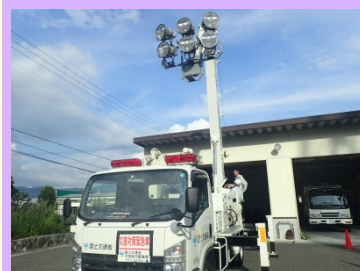
災害対策車の操作訓練