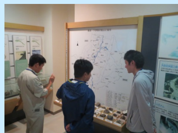
かわらんべにて施設見学と 過去の災害についての学習