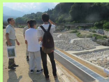
与田切床固工群工事 現場見学