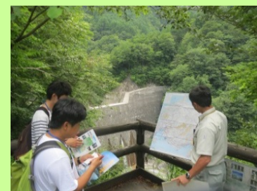
飯島第6砂防堰堤にて 与田切川の砂防事業説明