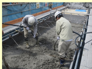
塩川第2床固工群工事現場にて コンクリート打設作業体験