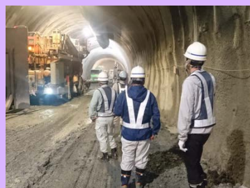
穴沢砂防堰堤 管理用トンネル工事見学