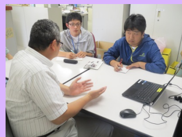
職員による九州北部豪雨 TEC-FORCEでの体験談