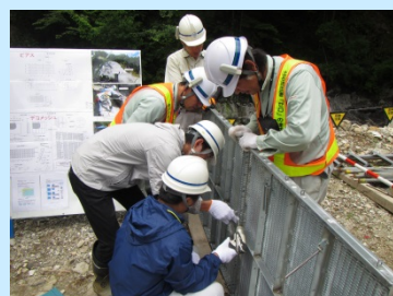
黒川第4砂防堰堤工事現場にて 型枠組立作業体験