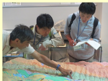
中央構造線博物館にて 伊那谷の地質について学習