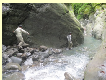
小渋川流域溪流現地踏査