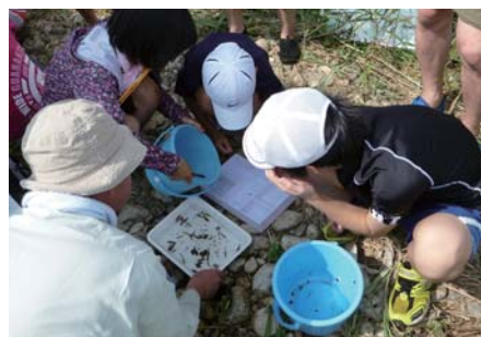
生きものを調べて水質を知る