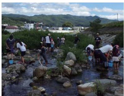
川にたくさんの生きものがすんでいることを知る

川の生きものを捕って・観察する学習の機会であるとともに、川とのふれあいが体験できる楽しい調査ですので、ぜひご参加ください。