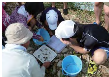
生きものを調べて水質を知る