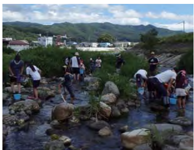
川にたくさんの生きものがすんでいることを知る

川の生きものを捕って・観察する学習の機会であるとともに、川とのふれあいが体験できる楽しい調査ですので、ぜひご参加ください。