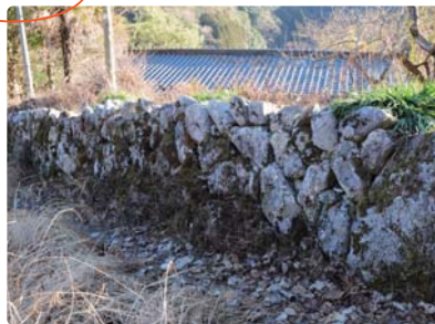
例) 名古屋の水除け (なごやまのみずよけ)