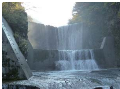
例) 上蔵砂防堰堤 (わざさほうえんてい)