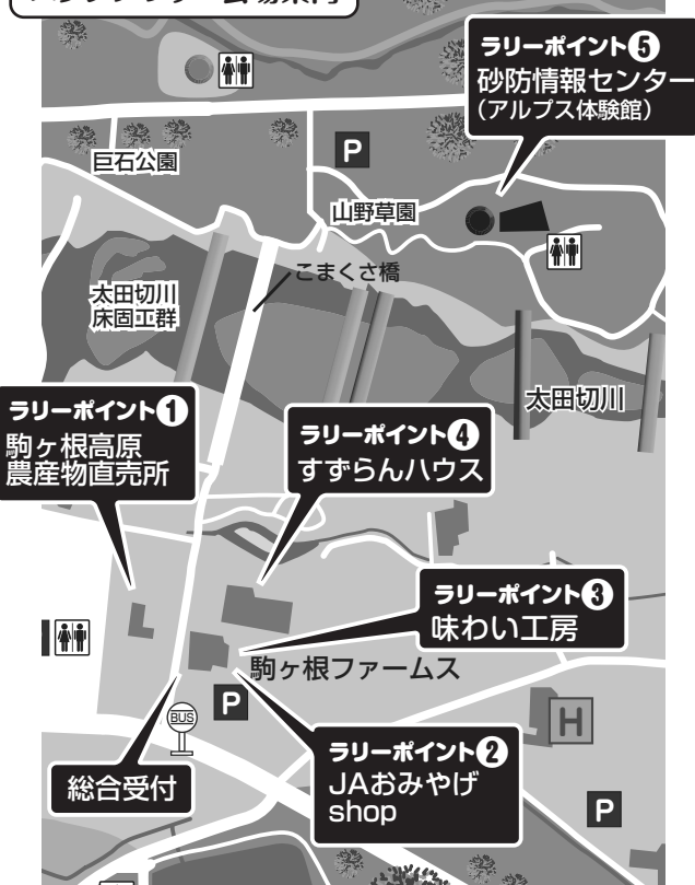
スタンプラリー会場案内