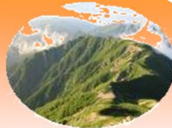
南アルプス(仙丈ヶ岳)