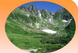
中央アルプス(駒ヶ岳)