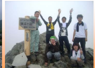
※写真は昨年度仙丈ヶ岳に登山した様子