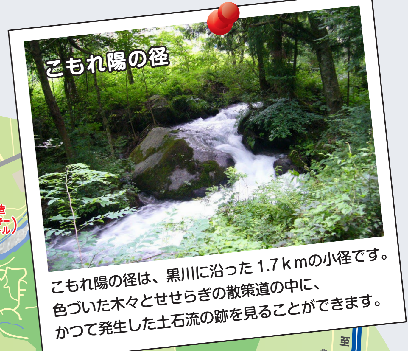
こもれ陽の径は、黒川に沿った1.7kmの小径です。色づいた木々とせせらぎの散策道の中に、かつて発生した土石流の跡を見ることができます。