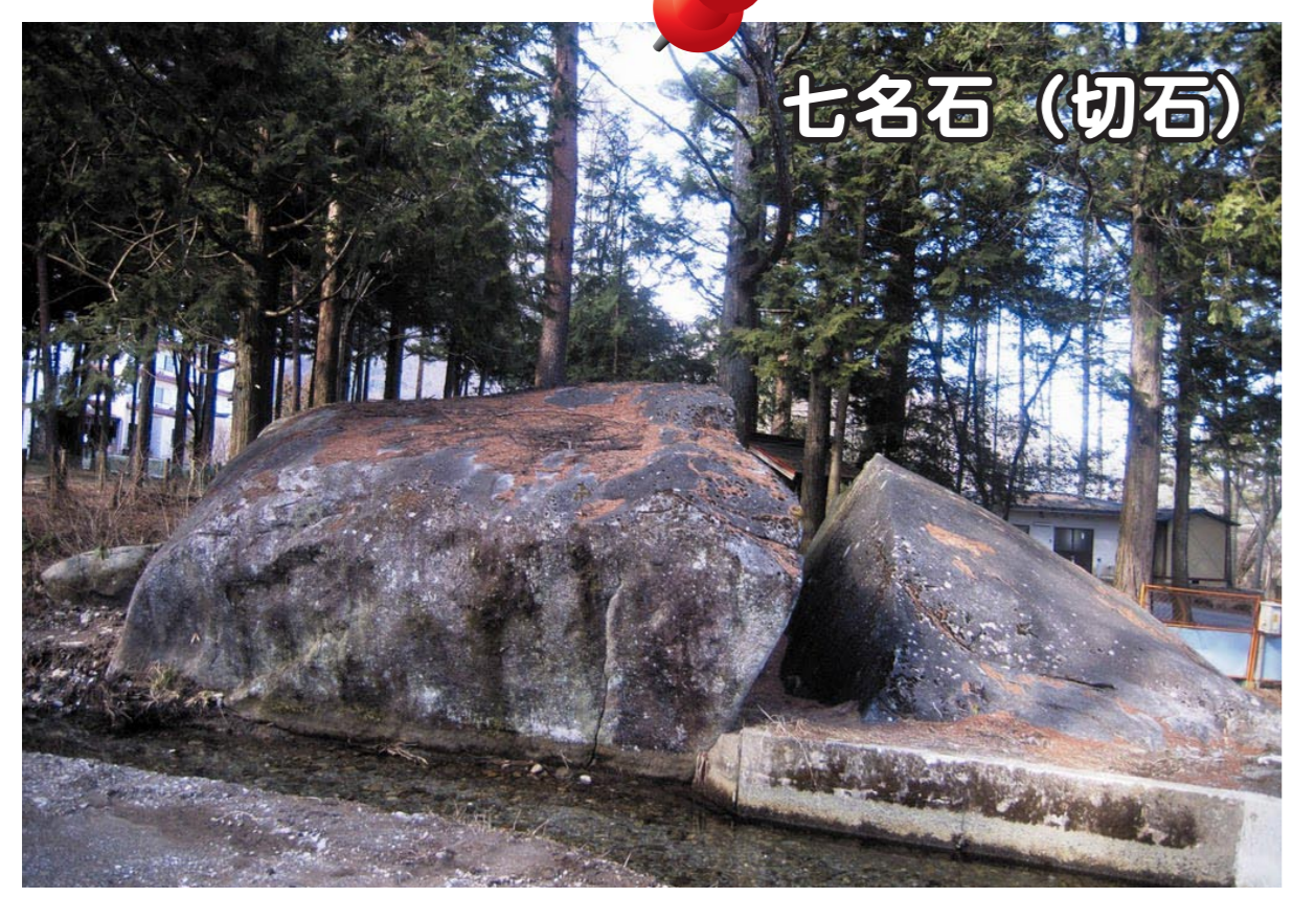
刃物で切ったように真二つに割れているのが特徴で、武蔵坊弁慶が試し切りしたともいわれています。ツアーではこのような巨石が太田切川沿いに点在している不思議についてお話します。