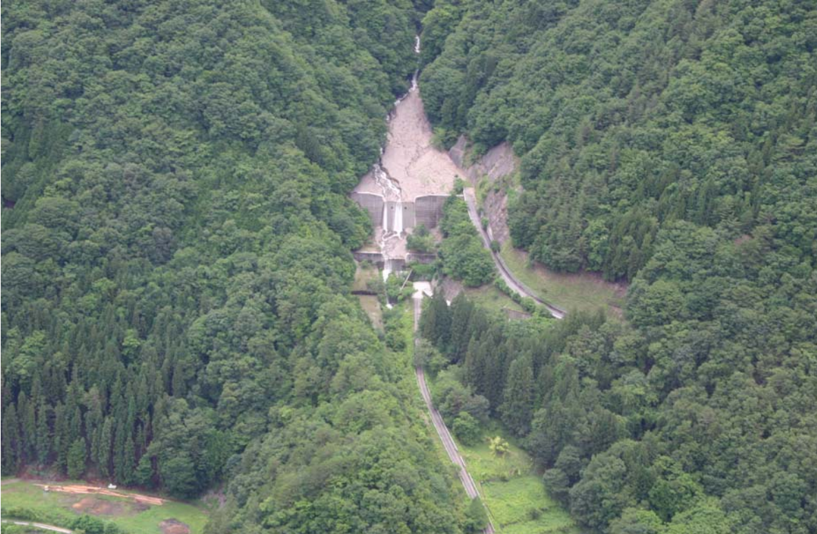
① カミカラサワ 上唐沢砂防堰堤