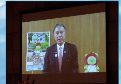
長野県知事からビデオメッセージ