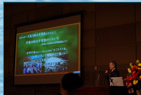
天竜川総合学習館「かわらんべ」

開催日：令和4年12月22日 会場：岡谷市カノラホール 主催 国土交通省、長野県 天竜川上流流域治水協議会