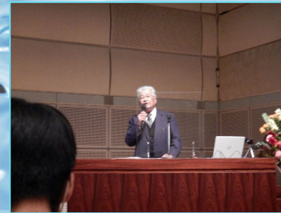
三峰川みらい会議