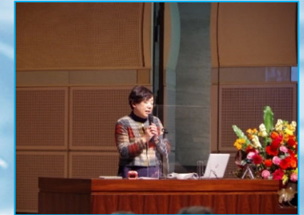
防災ネットワークしもすわ