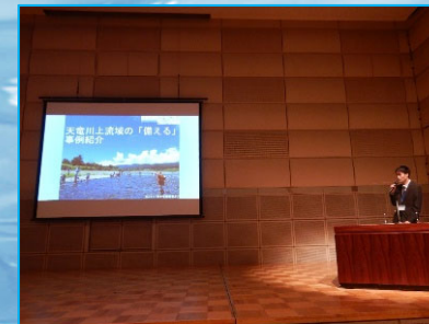
天竜川上流河川事務所