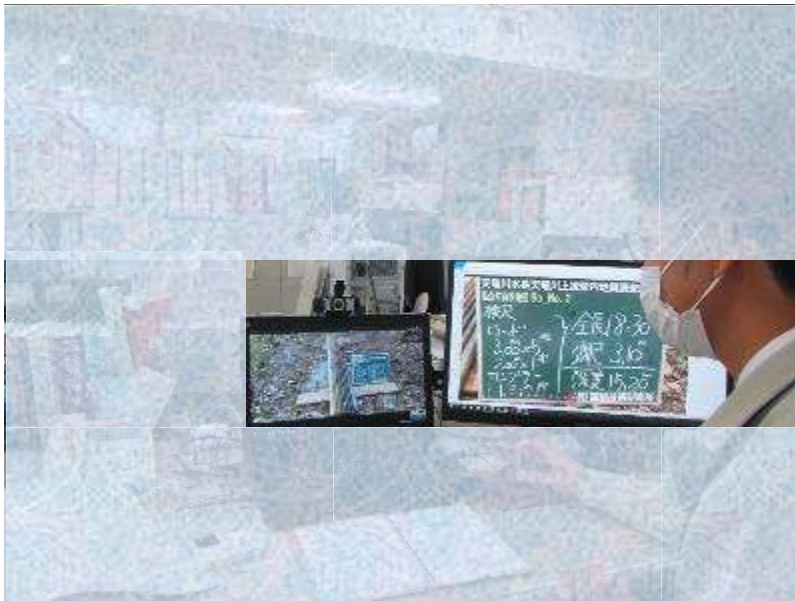
↑オンライン検尺の様子