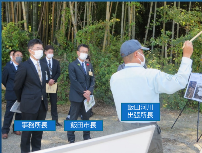
飯田河川 出張所長