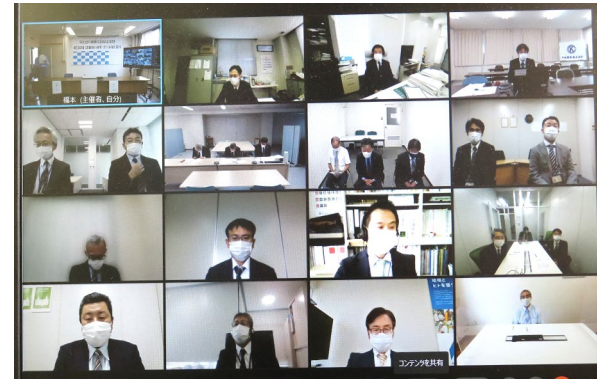
【協定締結業者 一覧】

当日は新型コロナウイルス感染防止のため、上伊那地域以外の業者はWEBによる参加となりました。