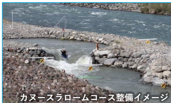
カーニスラロームコース整備イメージ