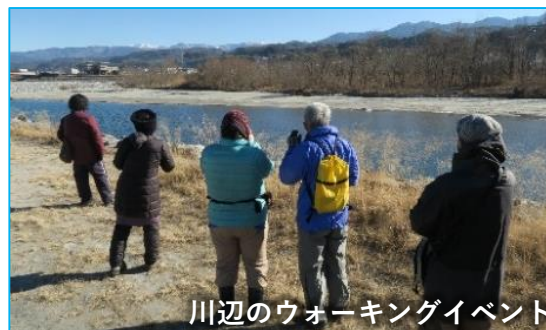
川辺のウォーキングイベント