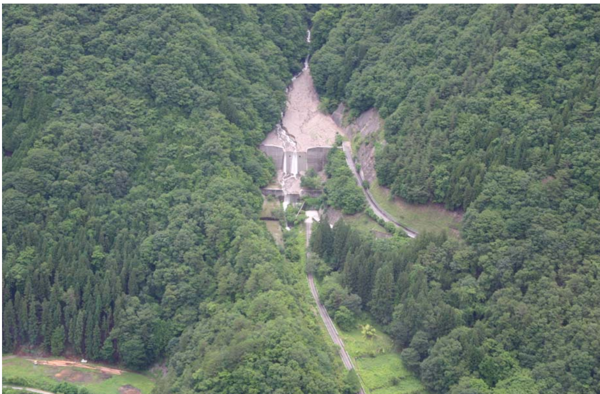
① カミカラサワ 上唐沢砂防堰堤