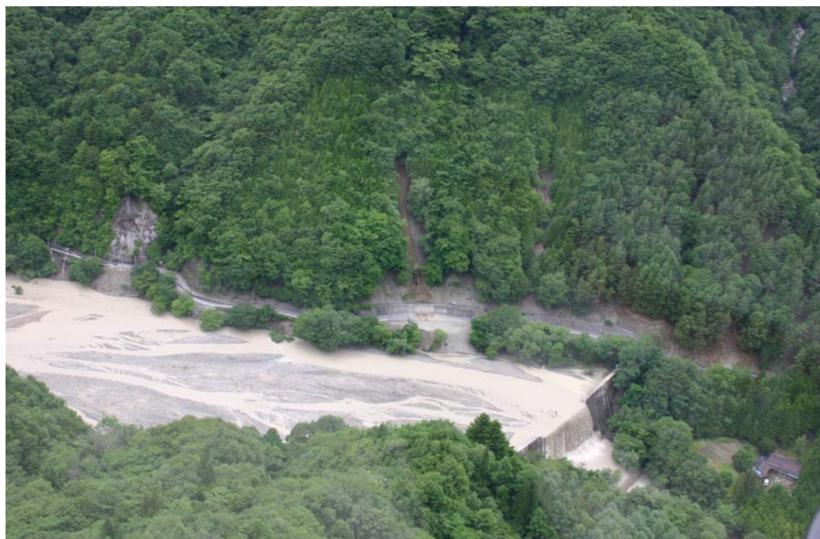
② モモダイラ 桃平第2砂防堰堤