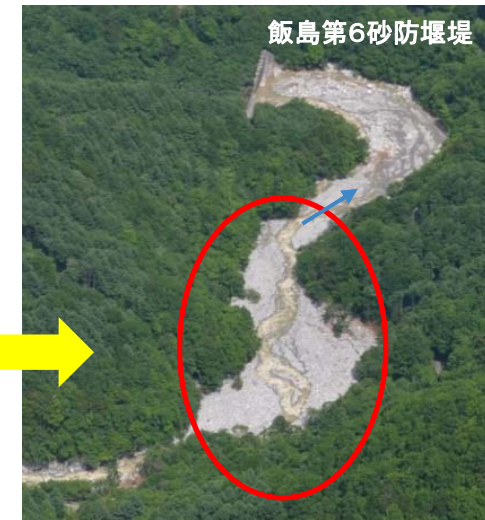
捕捉後(令和2年6月15日)