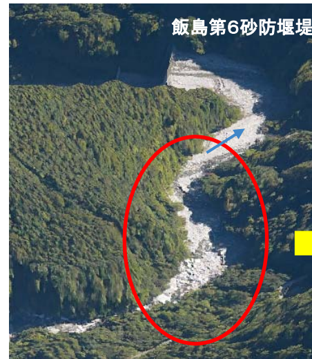
捕捉前(令和元年11月 オルソ画像)