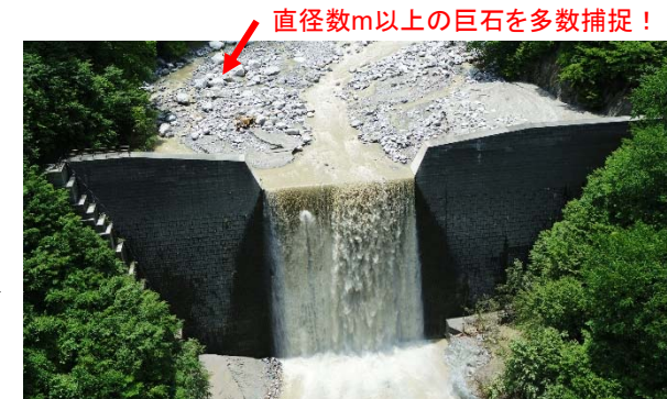
飯島第6砂防堰堤の捕捉状況