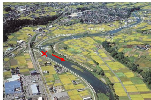
× : 決壊箇所 堤防決壊前の全景