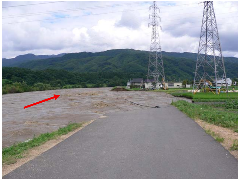
① 7/19 堤防決壊直後(上流側から)