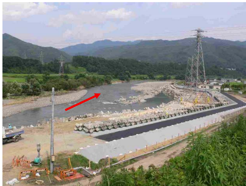
⑨ 7/31 15時 緊急復旧完了