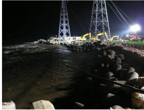
③7/21 19時30分 応急復旧工事完了