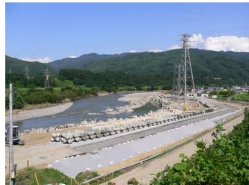
⑧7/30 15時 大型連節ブロック張施工状況