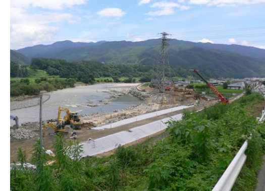
⑦7/27 12時 築堤盛土の状況