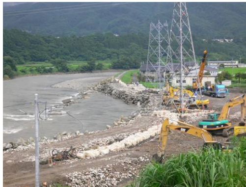
⑥7/24 15時 緊急復旧工事の根固ブロック投入状況