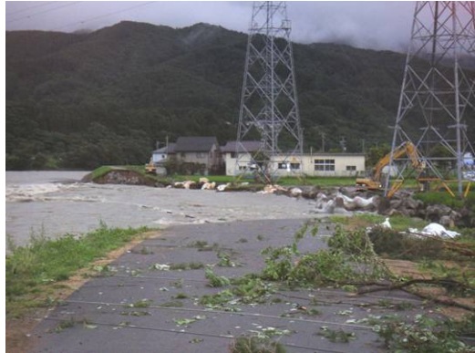
②7/20 9時 応急復旧工事施工中(上流側から)