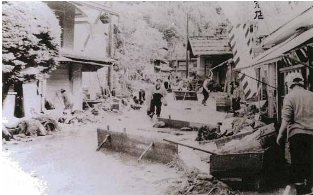
熊堂沢の氾濫により、市野瀬村中に土石流が流入。