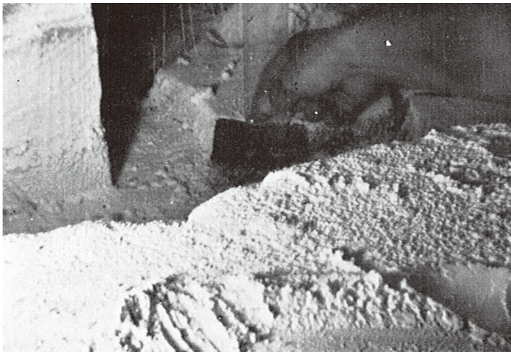
伊那里小学校体育館床下に流入した土砂