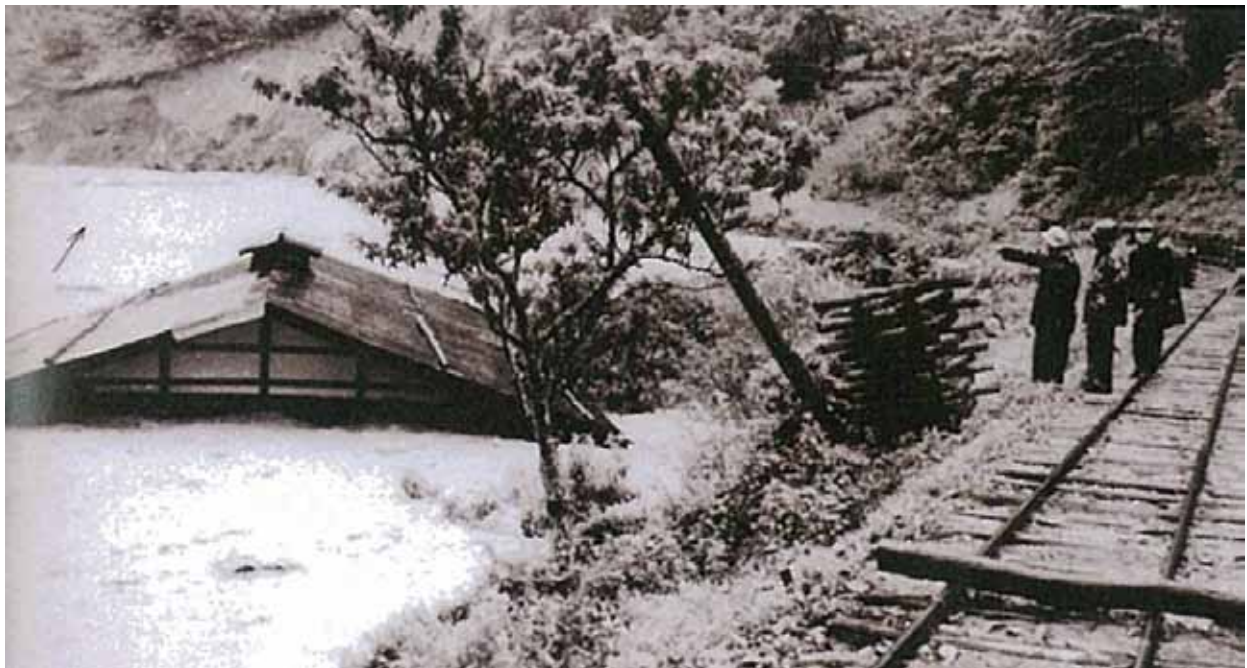
戸草集落の流出と森林鉄道の決壊。森林鉄道は全線にわたって決壊し、以後廃線となる。