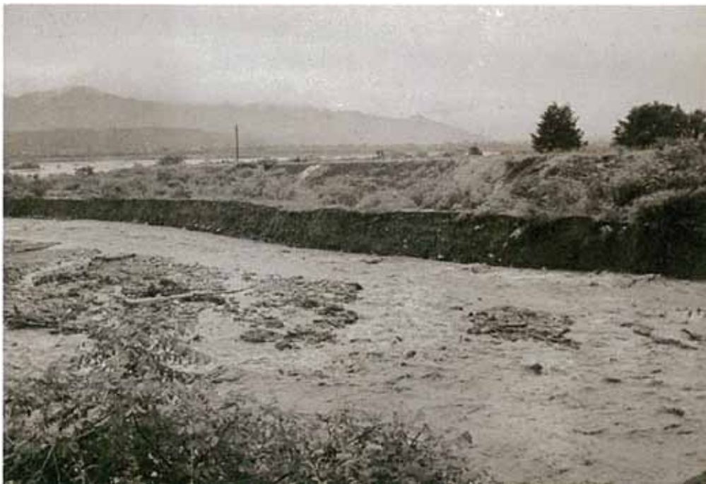
上島側の河岸の侵食状況