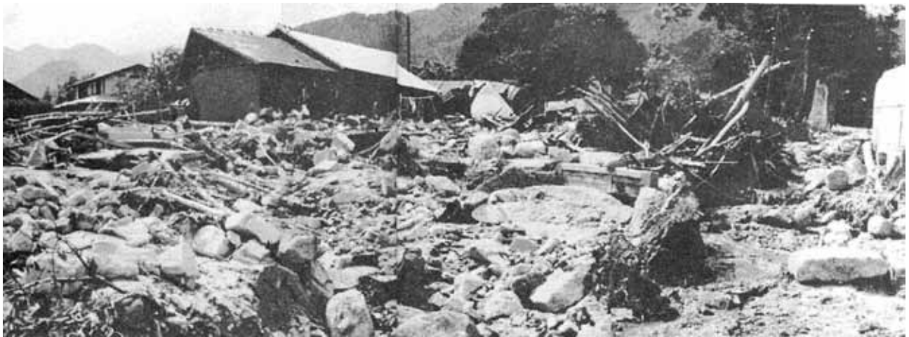
今宮市営球場横 山津波で家屋の倒壊、流失が生々しい状況