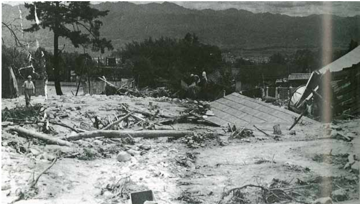
土石流で被災した丸山地区