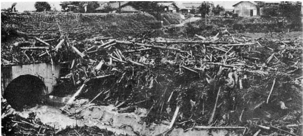
野底川の氾濫を物語る大量の流木