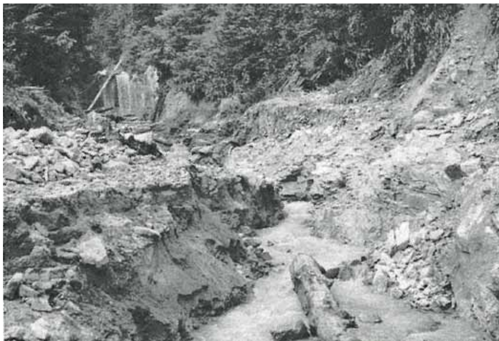
上郷町野底川の被災状況