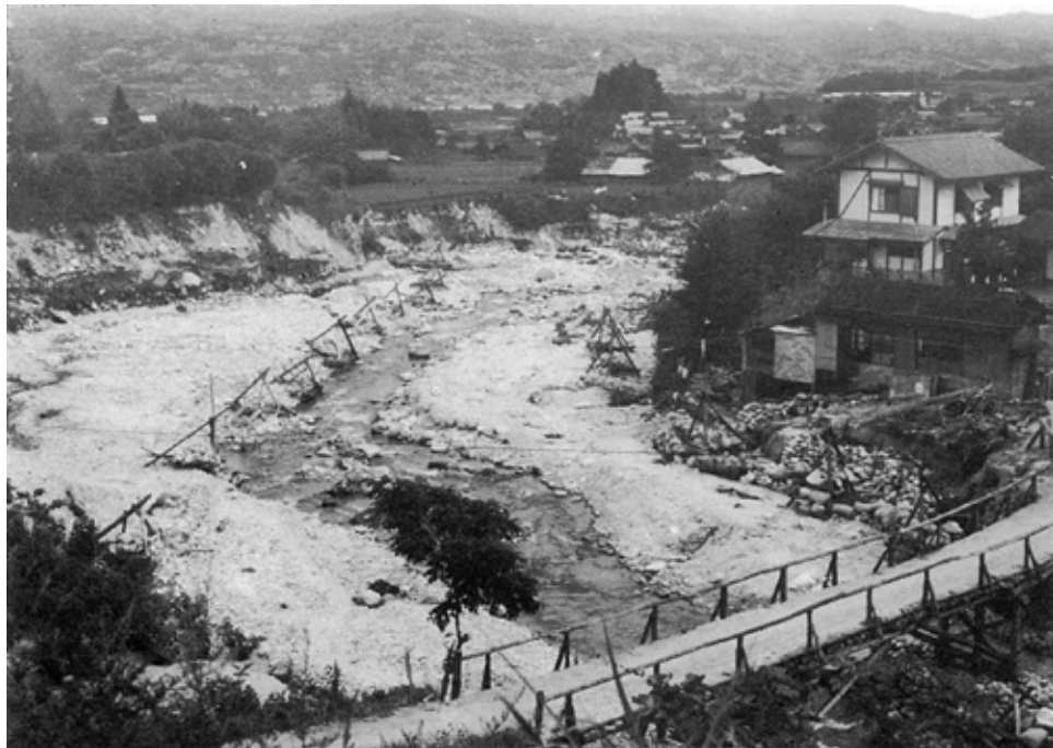
野底川筋上郷町都出橋付近の惨状