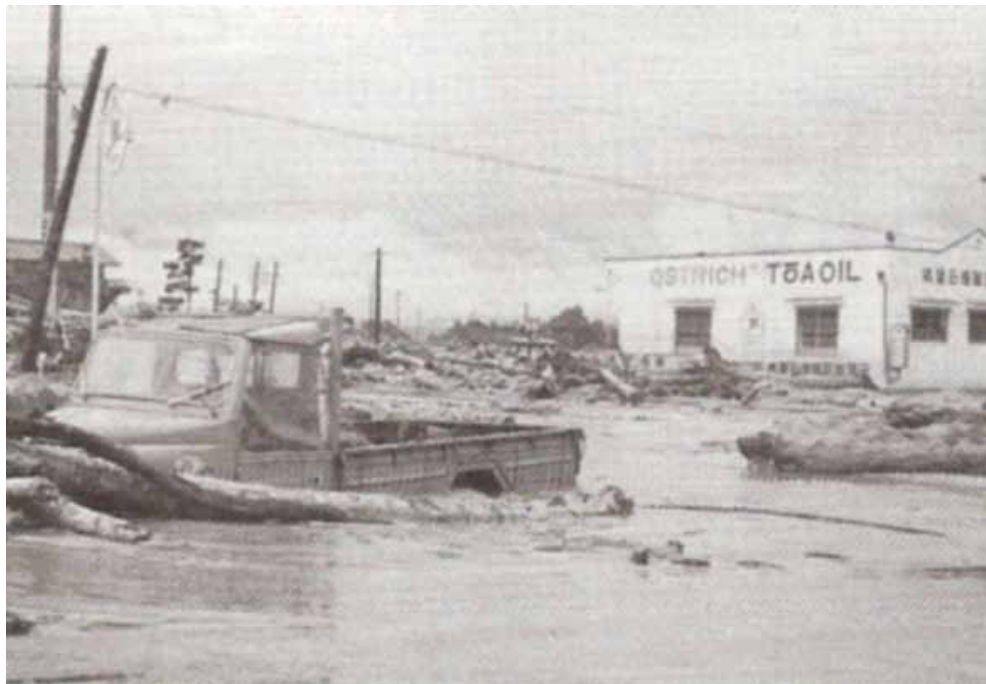
野底川の氾濫で浸水した町