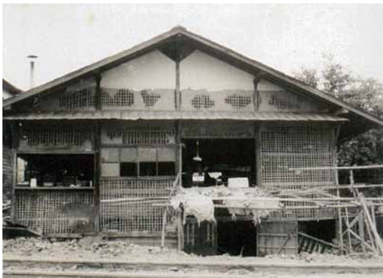
飯田線の線路脇の被災した家屋 家の前の 2 本の線は飯田線の線路