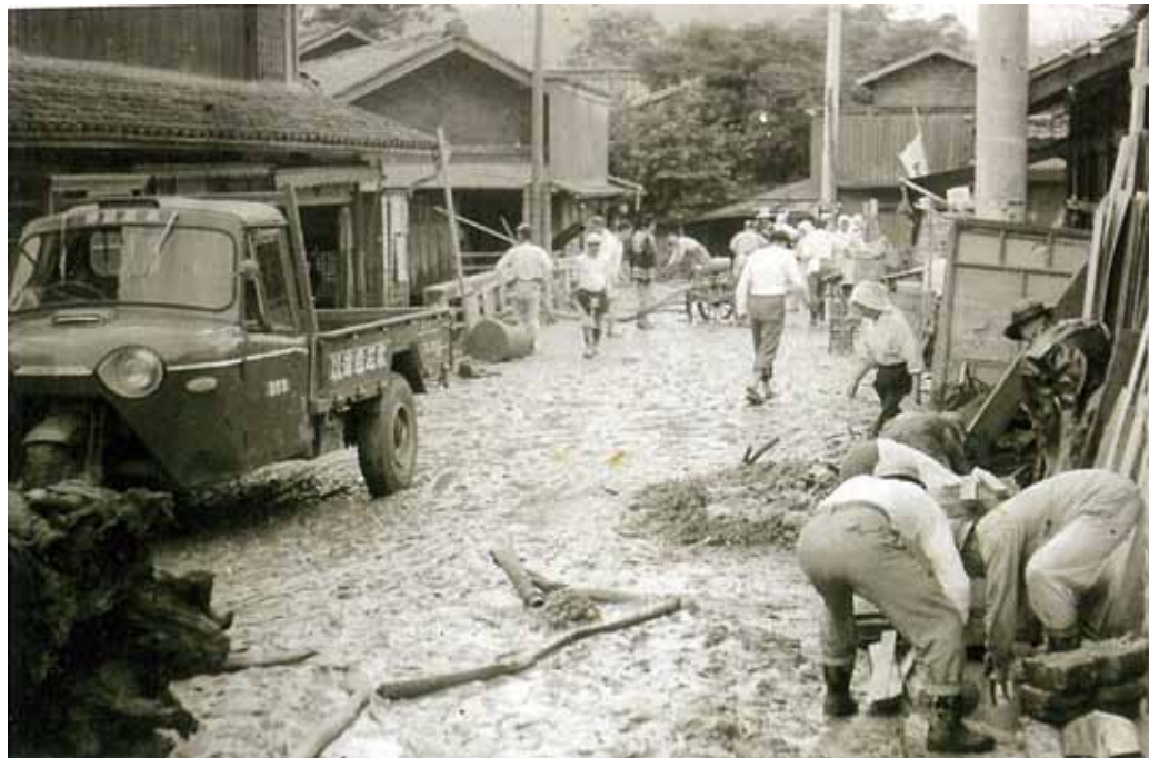
泥のかき出しなど復旧作業に取り組む人々