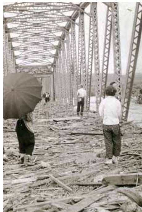
流木で埋め尽くされた水神橋の橋上