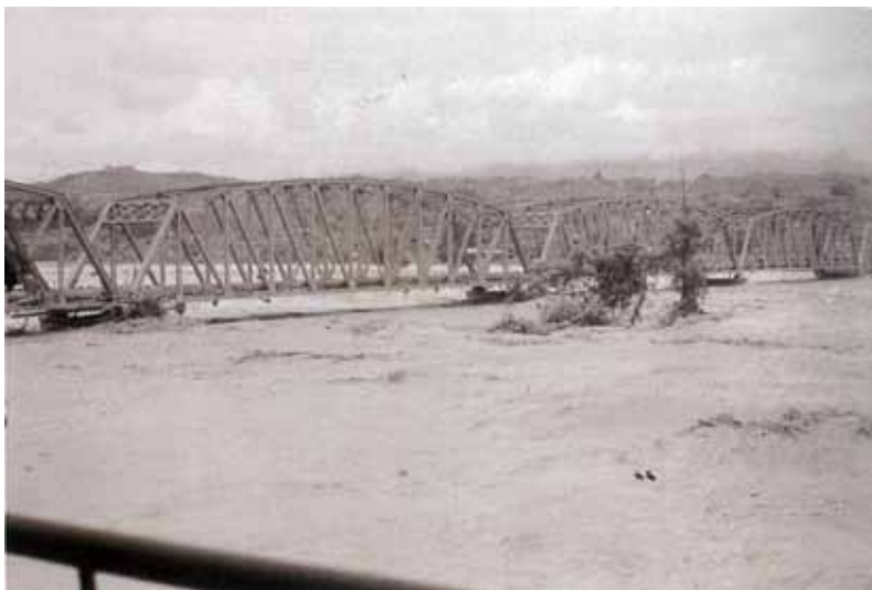
浸水に脅かされた一夜が明けた、水神橋