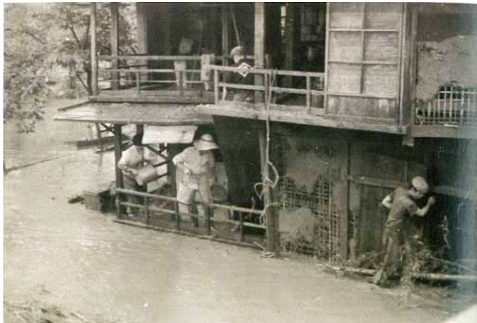
被災家屋の水のかき出し 流されないように注意しながら、家から水をかきだしているところ