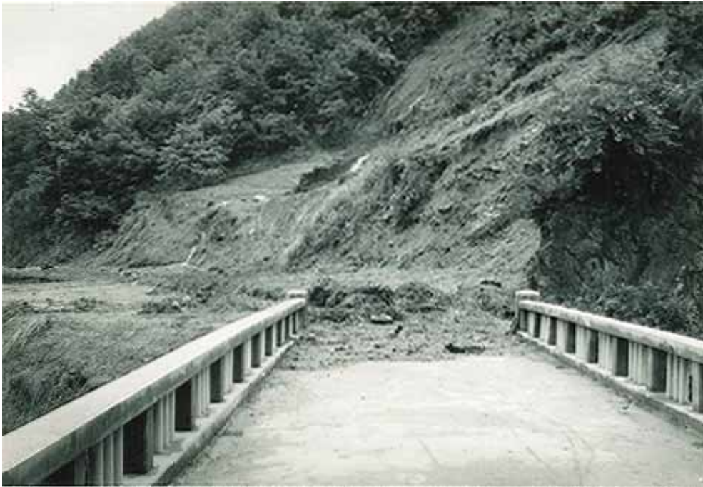
県道上飯田線の道路被災と斜面の崩壊