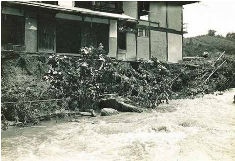
民家のすぐわきを流れていく、富田沢川の濁流