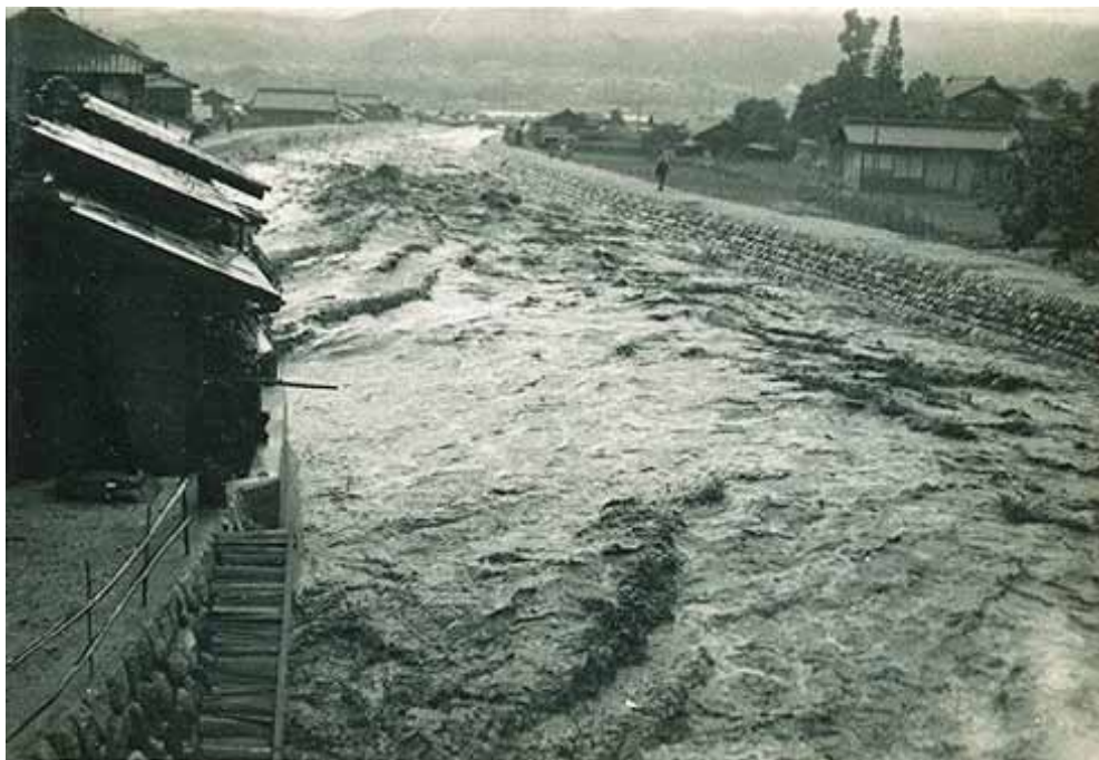
濁流が流れる加々須川