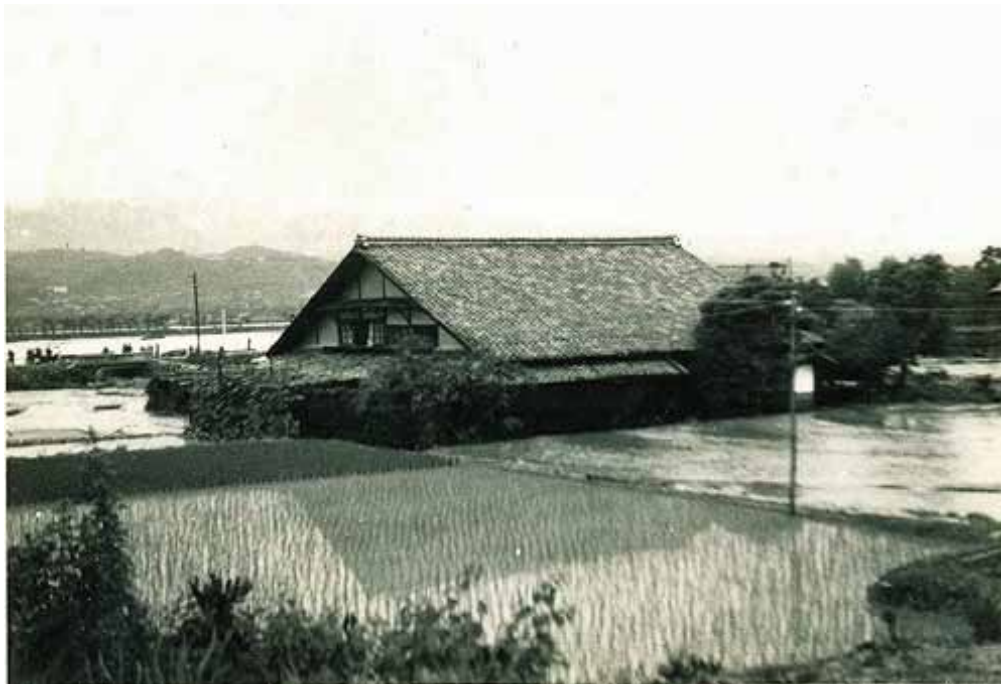
泥水に冠水した水田