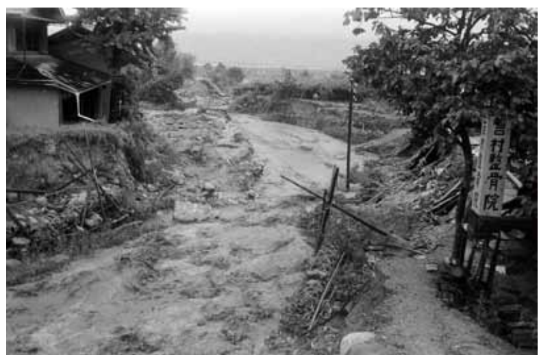
寺沢川の濁流により削られ、浸食してしまった岸