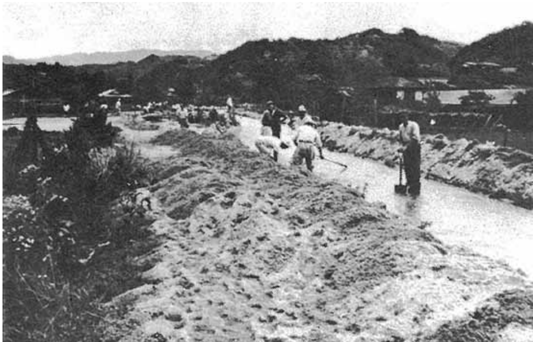
土砂で埋まった市の沢川