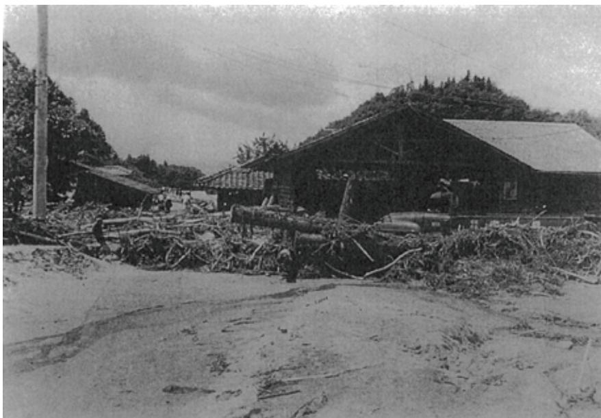
被災した間沢川河口付近の家屋