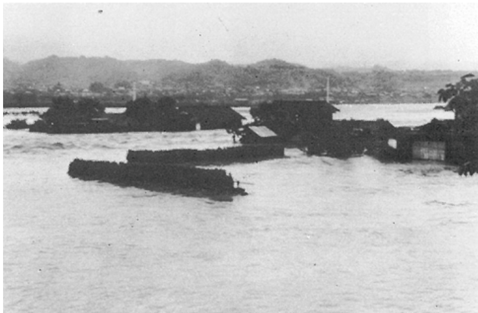
天竜川の氾濫で水に浸かった豊丘村道西島地籍