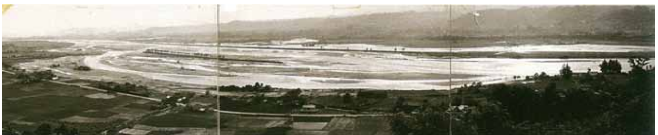
伴野堤防決壊のより濁流に浸った伴野新田。向かい側は惣兵衛堤防下方