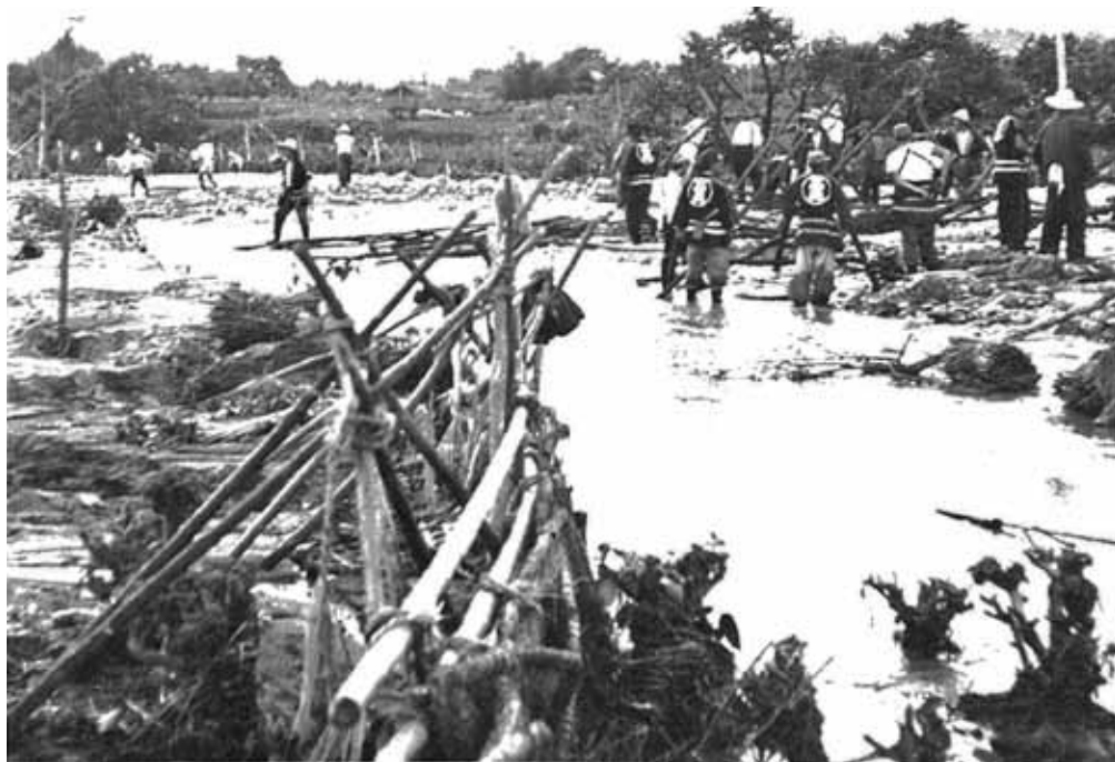
下市田上洞付近の氾濫と水防作業の状況