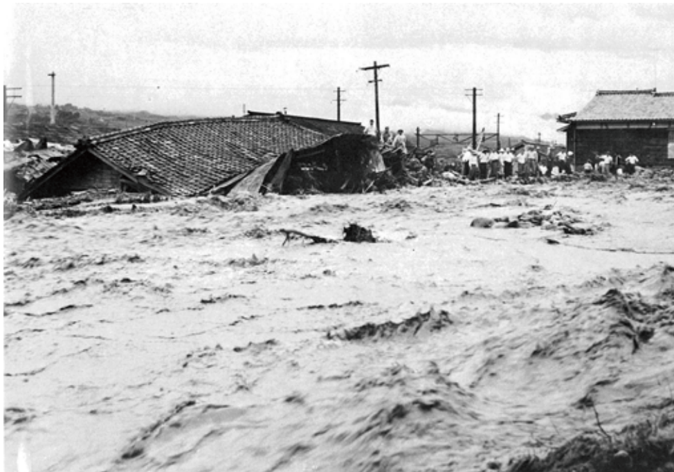
市田駅の貨物ホームの西方付近で大島川の濁流に洗われる住宅