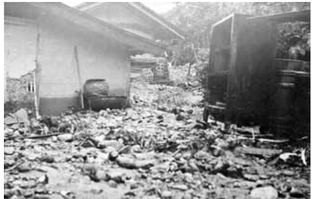
唐沢洞の氾濫で土砂に埋まった建物