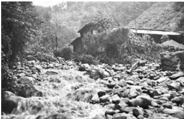
中学校の南下の唐沢洞の氾濫状況