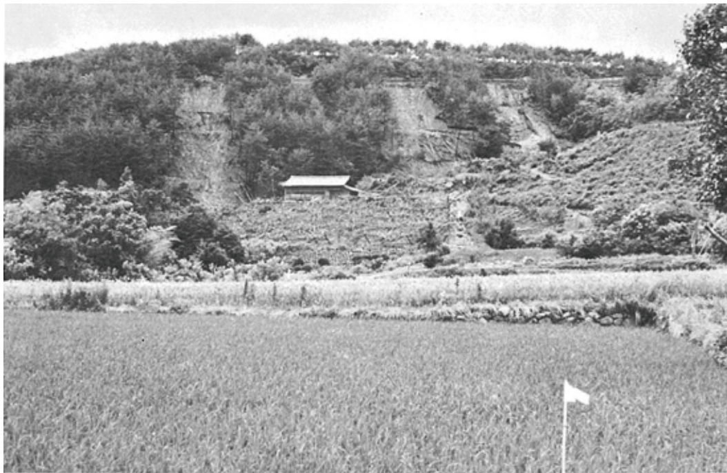
山吹新田原の東端の本坂地籍の山腹崩壊