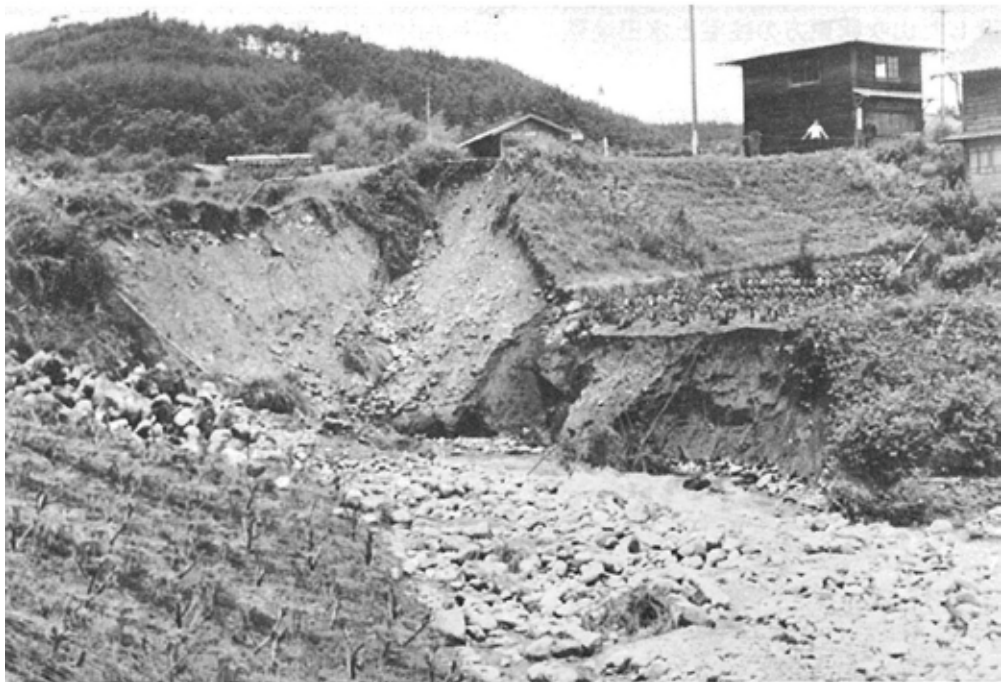
寺沢川ので水で欠潰した町道中央線