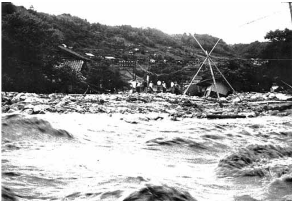
田沢川の濁流に洗われる下平駅。前方が山吹駅方面