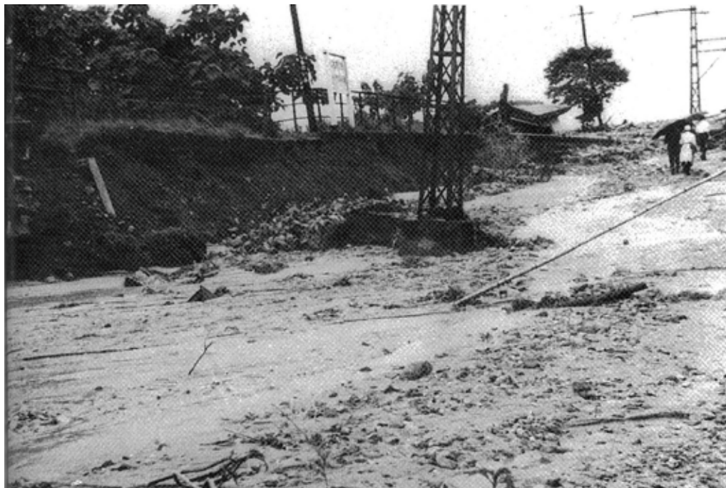
山吹下平駅付近の災害状況。