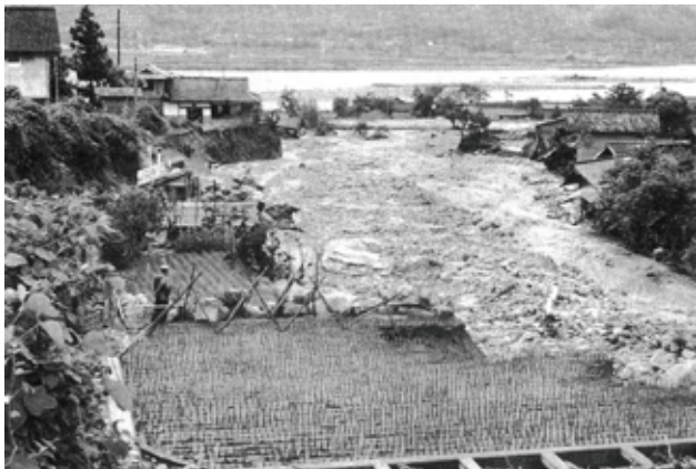
田沢川の一貫水路付近から天竜川下流を見たもの。前方は天竜川、手前は竜西一貫水路。