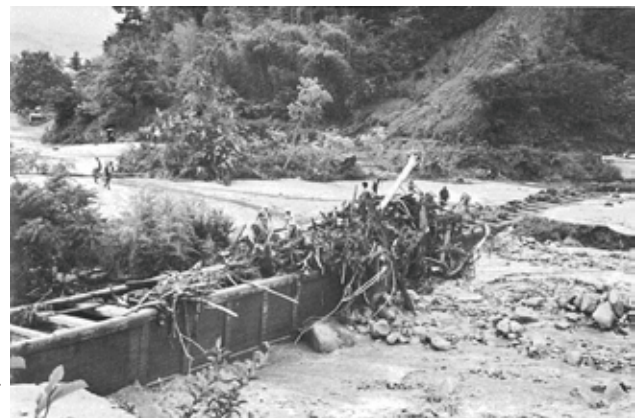
田沢川の一貫水路の水路橋。災害直後、流木がつまって被害を大きくしたが、南側と北側を連絡する唯一の通路だった。